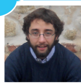
MATTIA 3 a Teologia RELAZIONI

“ Incontrare, ascoltare, accogliere, gioire e piangere, insieme. Scoprirmi non più solo, ma amato e capace d'amore. Venite, camminiamo nella luce del Signore! ”